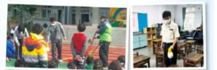
苗栗縣中山國小多元展能成果一覽表

三、一週內，低年級同一班有兩位以上感染腸病毒，該班按規定必須停課一週，該班學生必須在家中自主健康管理。 四、請多注意孩子的個人衛生，提醒孩子勤洗手，並且均衡飲食，適度運動及充足睡眠，以提昇免疫力。