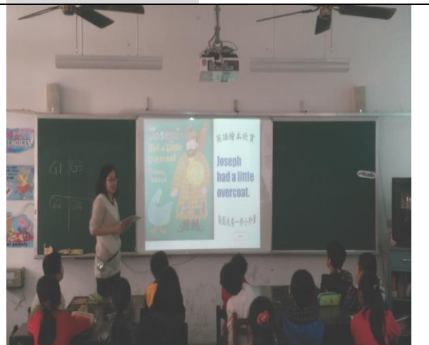
說明四：英語繪本教學