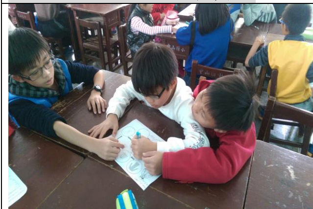
說明五：小組討論並填寫學習單