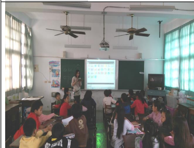
說明三：IPAD APP 運用於教學輔助