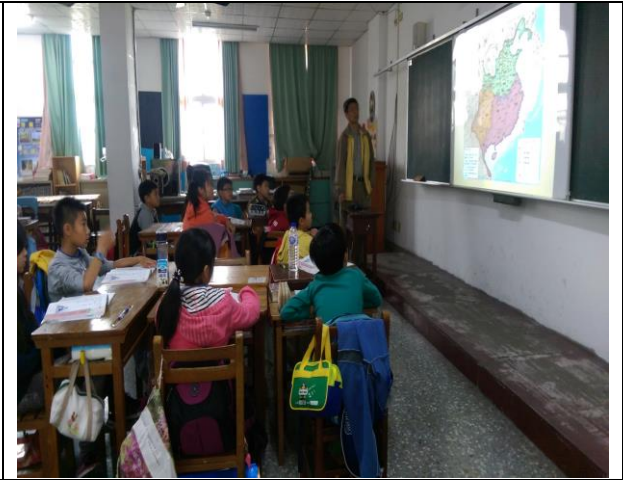
說明二：藉由圖表推論三國情勢