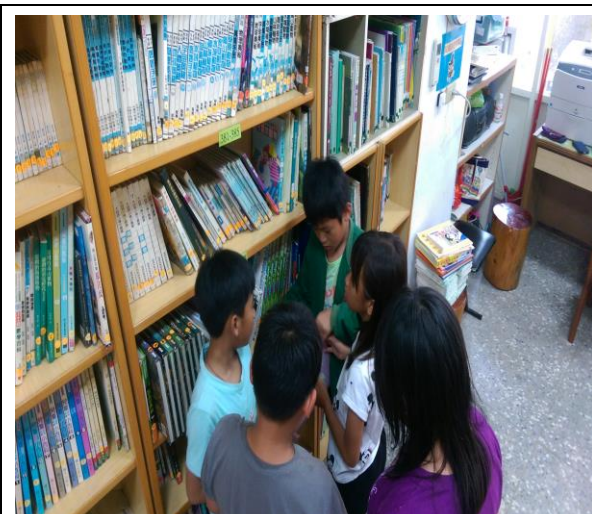
至該圖書分類找到文本解題