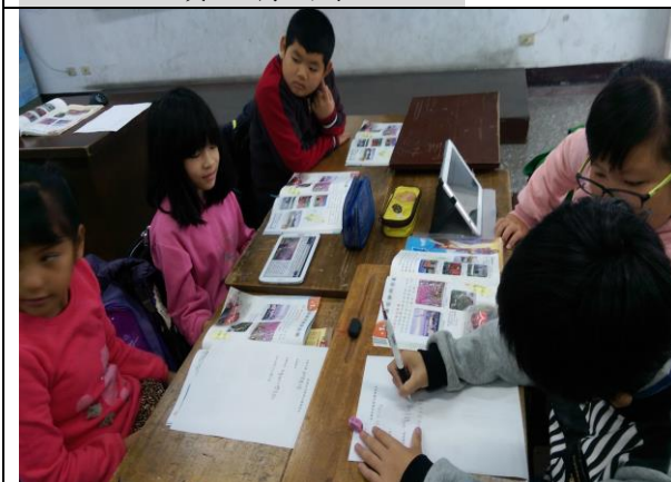
說明五：搜尋資料並填寫學習單