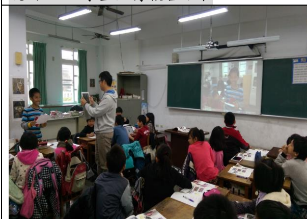
說明三：實況轉播學生報告