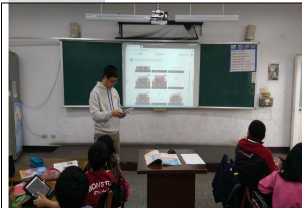
說明一：學生上傳報告結果