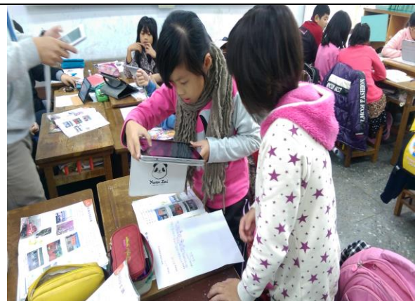
說明二：將文本重點拍照上傳