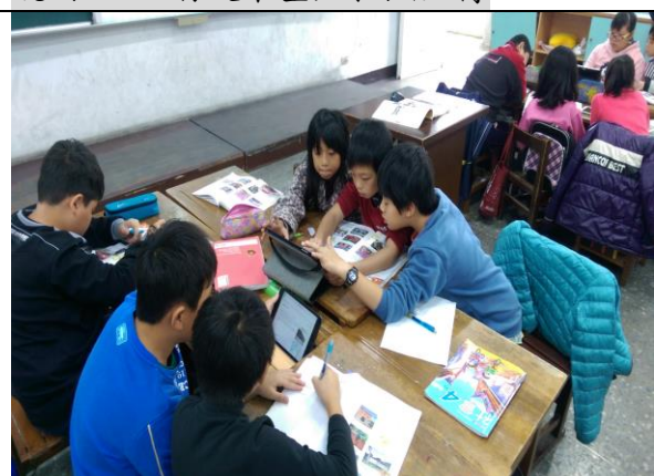
說明四：三人小組合作上網搜尋資料